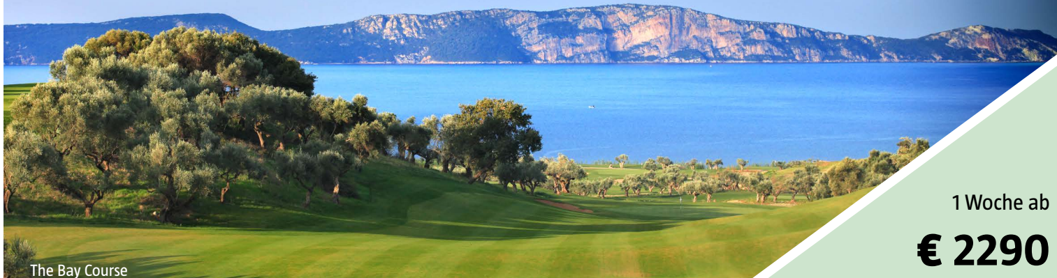
The Bay Course

Abreisen 28.2., 21.3. 28.3. 4.4. und 18.4.25