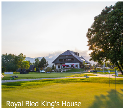
Royal Bled King's House

Der Golfplatz Bled, der älteste und größte Golfplatz Sloweniens, bietet eine