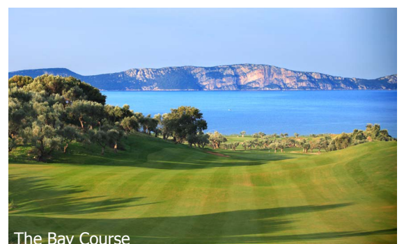
The Bay Course

WICHTIG: Limitierte Anzahl Flugplätze zu oben stehenden Konditionen. Ist die berechnete Buchungsklasse nicht mehr verfügbar, behalten wir uns vor, den Flugzuschlag aufzurechnen. Früh buchen lohnt sich! tb400